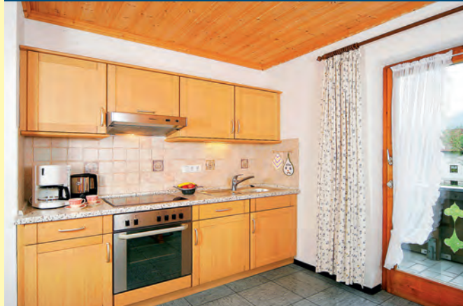
1. STOCK – SÜD- UND OSTBALKON