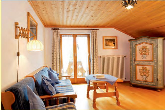
FERIENWOHNUNG NR. 2