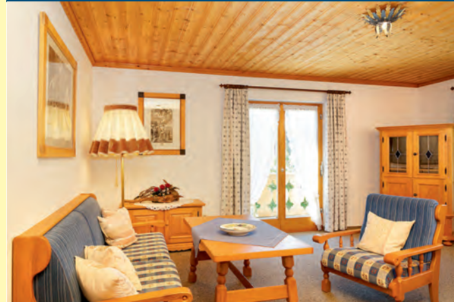
FERIENWOHNUNG NR. 4