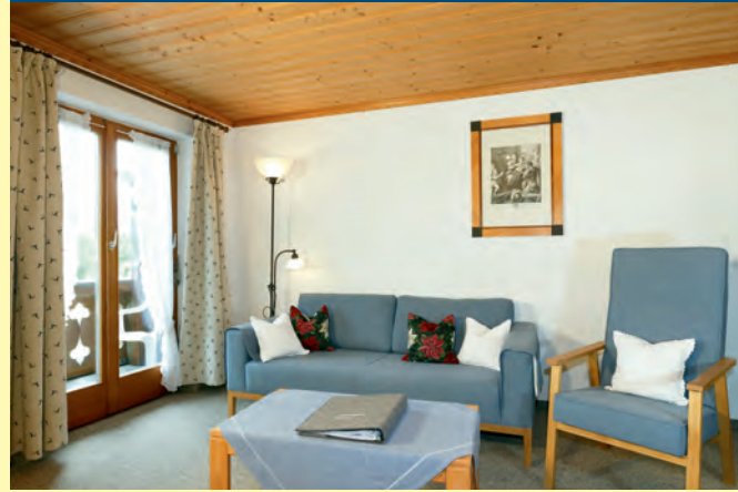
FERIENWOHNUNG NR. 1