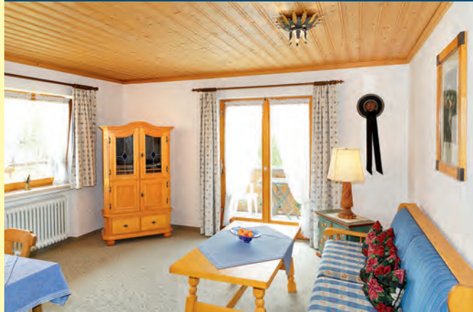
FERIENWOHNUNG NR. 3